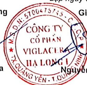
Nguyễn Chí Thanh