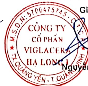
Nguyễn Chí Thanh